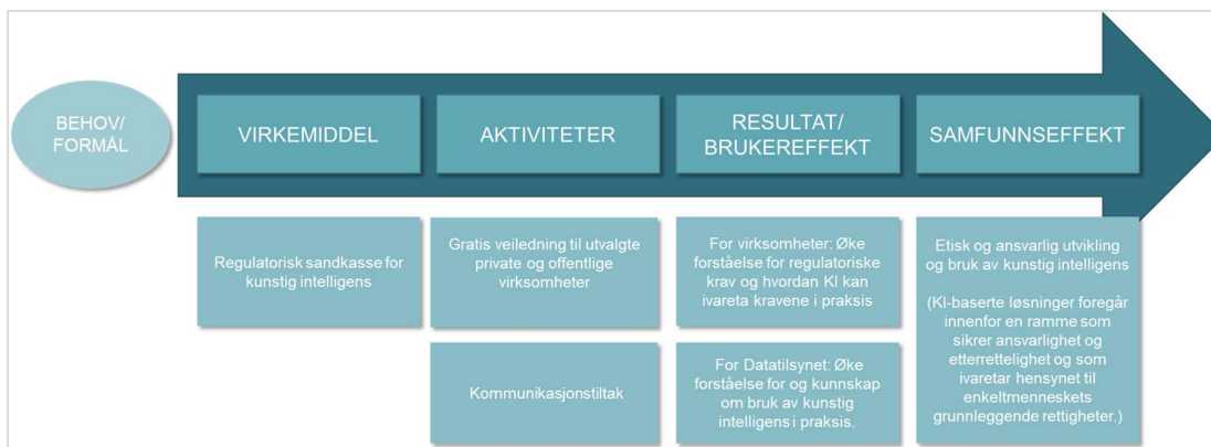
Figur 1 Resultatkjede for sandkassen

Hovedfokus i evalueringen er sandkassens effekt på eksterne sandkassedeltakere og andre som ikke har deltatt i ordningen, men som kan være interessert i læring fra sandkassen. Dette kan vi illustrere i en resultatkjede som vist i figur 1 under.